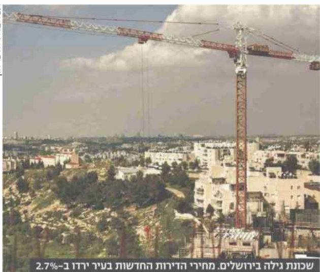
שכונת גילה בירושלים. מחירי הדירות החדשות בעיר ירדו ב-2.7%

« בעוד הקבלנים מתעקשים לטעון שאין ירידה במחירי הדירות החדשות, נתונים שפירסם אתמול משרד האוצר מראים כי בשנה האחרונה ירד המחיר החציוני של דירות חדשות ב-12.7% - ל-898 אלף שקל. נתון דרמטי אף יותר הוא הנפילה בנפח העסקות - בין נובמבר 2010 לנובמבר 2011 ירדו היקפי הרכישות של דירות חדשות ב-54%. נשיא התאחדות דות הקבלנים, נסים בובליל, תקף בתגובה את הממשלה, ואמר כי אינו מבין מדוע היא מתהדרת בהפלת היקפי העסקות בענף. בנובמבר נמכרו 6,848 דירות. אמנם מדובר בעלייה של 59% ביחס לאוקטובר, שהיה חודש של חגים, אבל אם משווים את מספר העסקות לנובמבר 2010, אז נמדדו כרו 10,300 דירות, עולה כי היקף המכירות ירד משמעותית. מחירי הדירות החדשות ירדו מאז אוקטובר האחרון ממוצע ב-1.8%, ומי שהוביל את הירידות היו דירות חדשות שנמכרו באזור ירושלים, שרשמו ירידת מחיר של 2.7%. בדירות ירד שנייה, מספר העסקות בנובמבר ירד בשיעור של 26% ביחס לנובמבר 2010, ובסי-